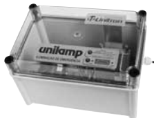
Unilamp 24 PG

Sistema centralizado, em 24 Vcc, para Iluminação de Emergência distribuída